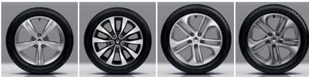
PLATIŠČE SARI 17"